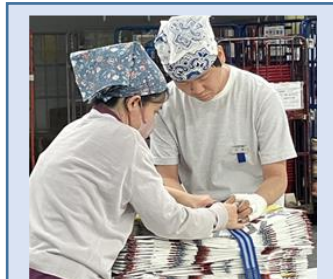
二重ショッパー 作成