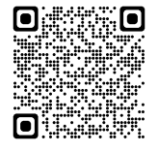
【各店舗の店長向け】