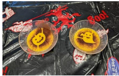
イベントのおやつ（ハロウィン）