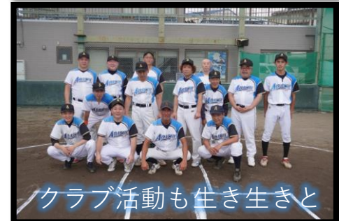
クラブ活動も生き生きと