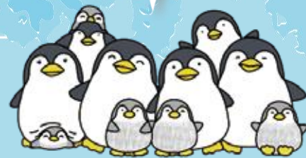
葛飾区社会福祉法人ネットワーク キャラクター かつぶくペンギンス

葛飾区内の福祉施設・事業所(障がい・児童・高齢)の求人があります。フルタイム、パートなど雇用スタイルも様々です。