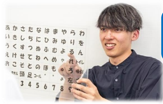
文字盤によるコミュニケーション支援

A 最初に、弊社または外部の研修施設にて、重度訪問介護従業者の資格を取得します。（費用は弊社が負担）。資格取得後、ご利用者様を担当している先輩ヘルパーとご利用者様宅で同行研修を行います。同行研修は、初回は見学メイン、2回目は半分の支援を行うなど、徐々に支援内容を習得していただきます。支援内容を習得したら、ご利用者様の担当看護師から実地研修で実技の試験を受け、合格するとひとり立ちとなります。ご利用者様、指導ヘルパー、あなたご自身が納得できまで丁寧にしっかりと指導を行いますのでご安心ください。