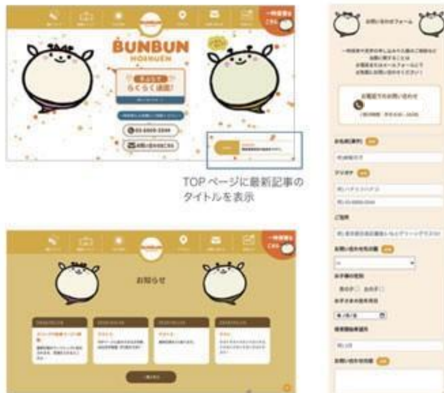
TOP ページに最新記事のタイトルを表示

お問い合わせは Contact form7 を使用。問い合わせ先の園ごとに送付先アドレスの分類・必須項目の設定・質問事項の充実を図ることで、スムーズな対応が可能に。