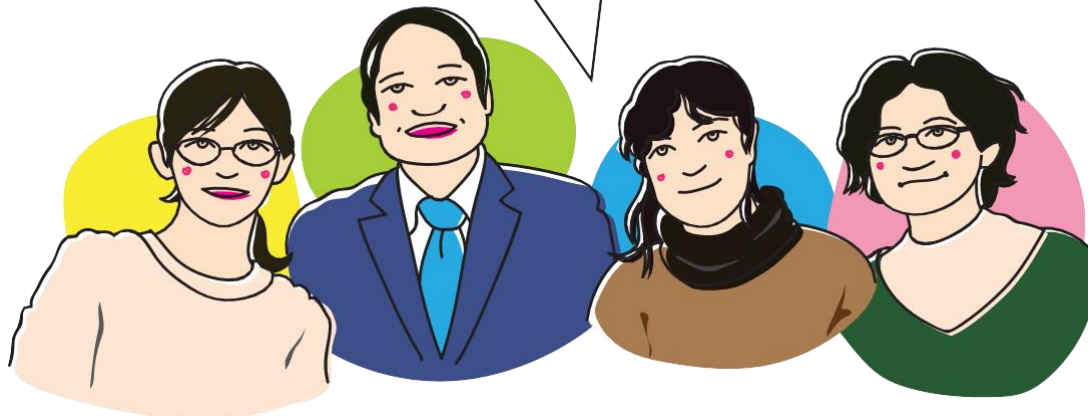
フェリカ TA スタッフ