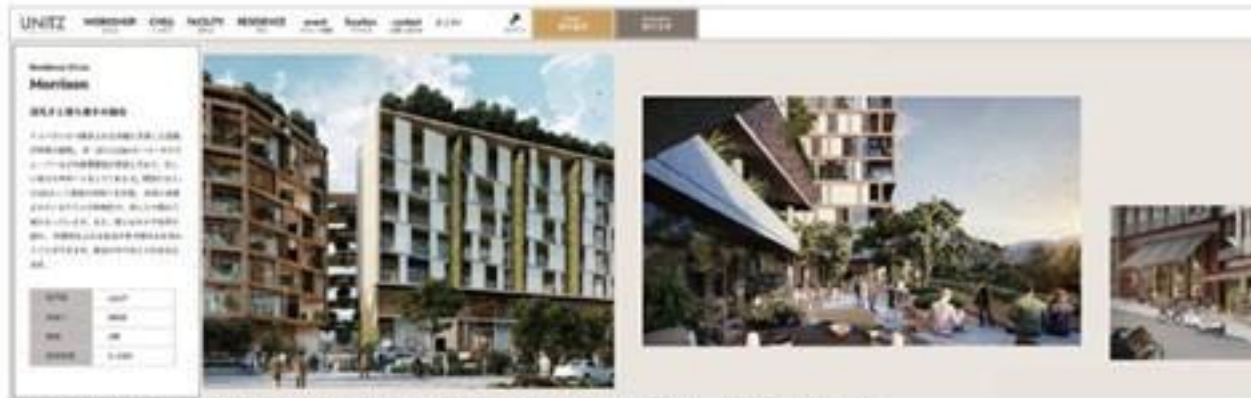
▲ 物件紹介ページは、施設の広大さを掻き立てるため、横スクロールで展開させた。

事業のコンセプトを視覚的に体感してもらうこと、団地のブランド感を引き出すという目的で画像メインのデザインを採用。要素の配置をずらして視点誘導を行ったり、アニメーションを加えるなどの工夫を行った。近年ビジュアルメインのミニマルデザインが多く見られる海外サイトを参考にした。