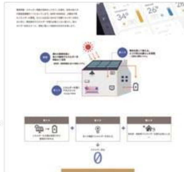
▲ テクノロジー紹介はアイコン化してシンプルに見やすく。