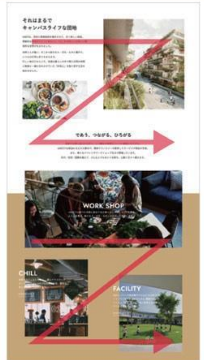
▲ 視点を誘導し気持ちよく情報が入るよう、要素を敢えてずらして配置。