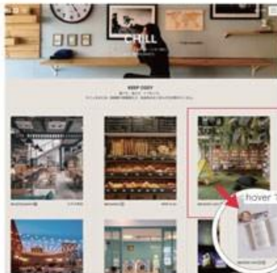
▲ 施設紹介は画像を並べ一括して表示。hoverで使用時をイメージしやすい画像が切り替わる仕組みも。