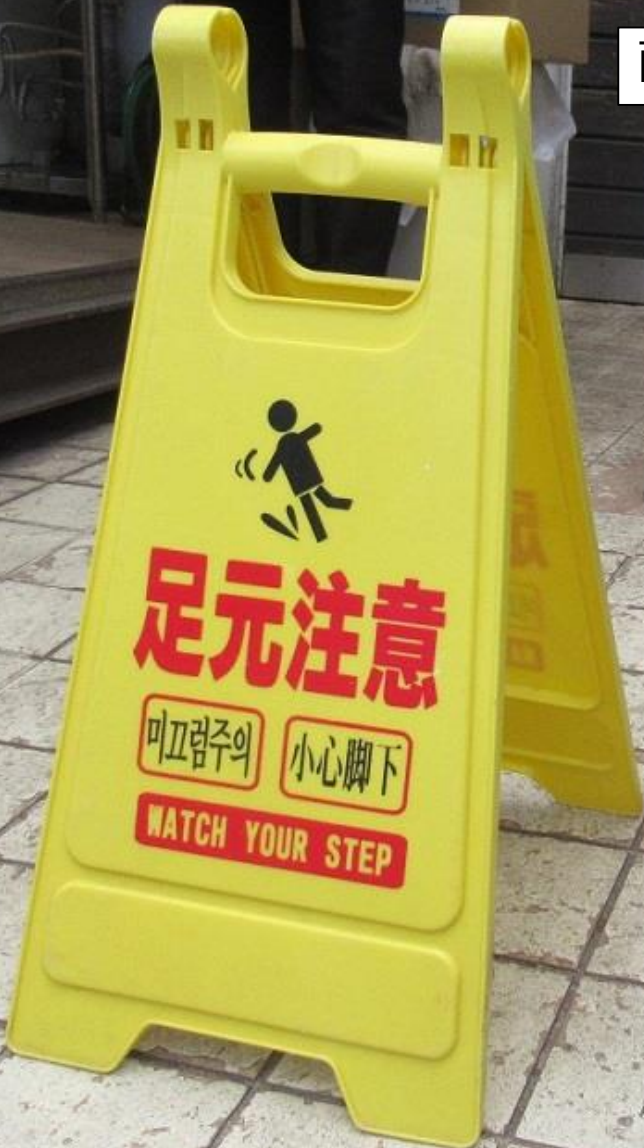
雨の日に設置する注意喚起看板