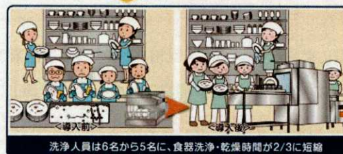
洗浄人員は6名から5名に、食器洗浄・乾燥時間が2/3に短縮