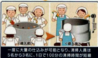
一度に大量の仕込みが可能となり、清掃人員は5名から3名に、1日で100分の清掃時間が短縮