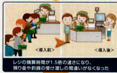
レジの精算時間が1.5倍の速さになり、預り金や釣銭の受け渡しの間違いがなくなった