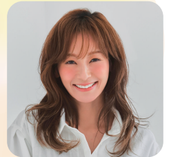
モデル・タレント 西山 茉希

育児と仕事の両立、仕事に復帰するときの不安などをどのように解決したのかを等身大で語るステージイベント!