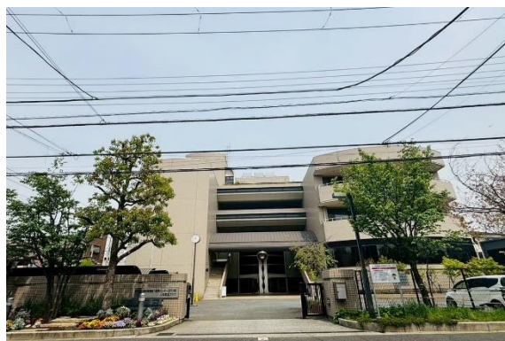
城東職業能力開発センター 江戸川校