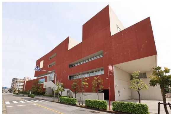
城東職業能力開発センター