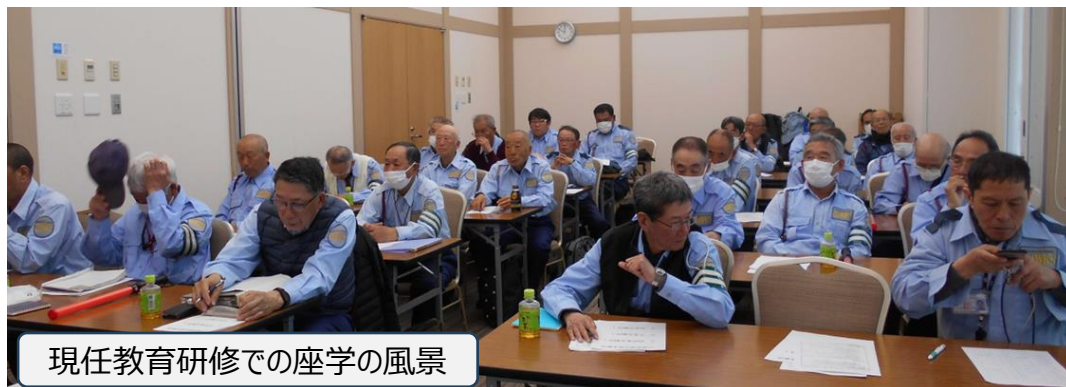
現任教育研修での座学の風景