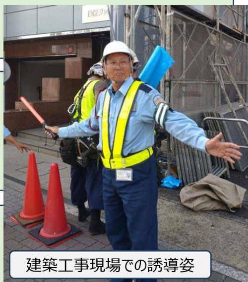
建築工事現場での誘導姿