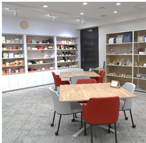
本社ショールーム