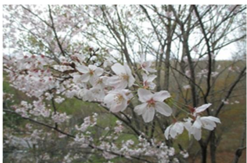
フロア 談話コーナーからの景色