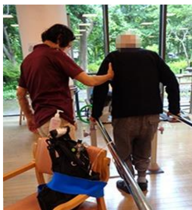
酸素療法時の歩行訓練