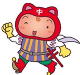
保生の森シールぼうや 選手権1位