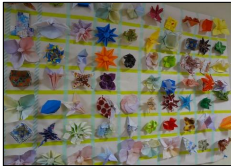
折り紙の壁面飾り