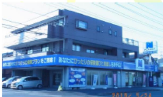
■本社 経営管理部 東京都青梅市新町4-8-2