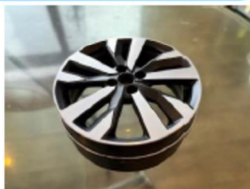
ホイールの試作モデル