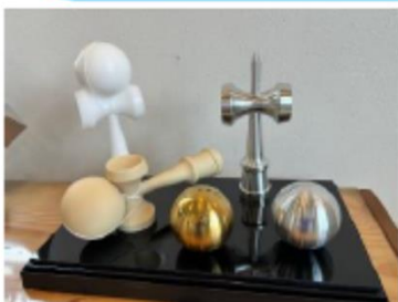
遊びで削ったけん玉