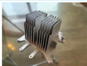
こんな細かいものもげずれます