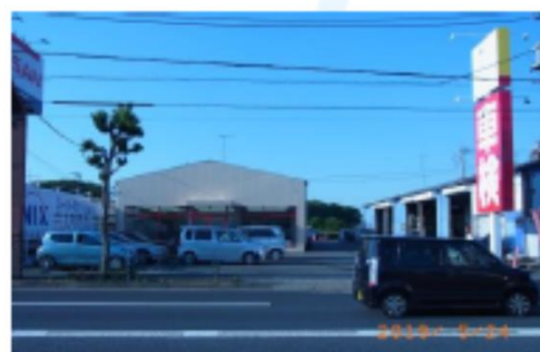
■コバック青梅店 東京都青梅市新町9-2203-4