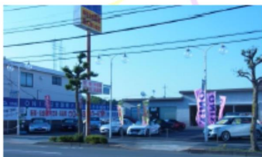
■オニクス新青梅店 東京都青梅市新町7-5-4