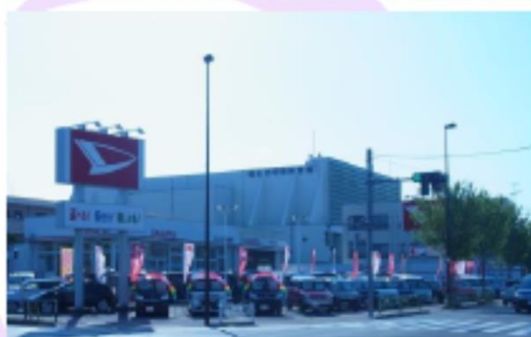
■ダイハツショップ福生田園 東京都福生市北田園2-5-1