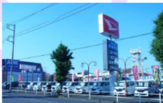
■オニクス羽村中央店 東京都羽村市栄町2-21-8