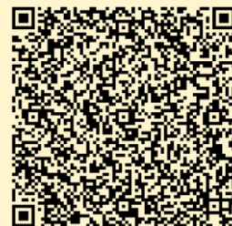
高木工業(株)求人一覧