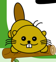
ハローキーパーくん