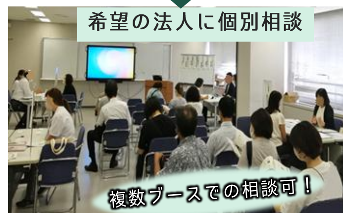
希望の法人に個別相談