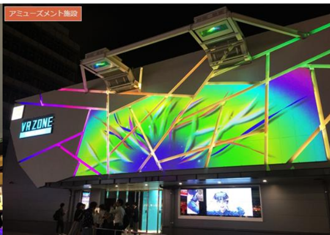
アミューズメント施設