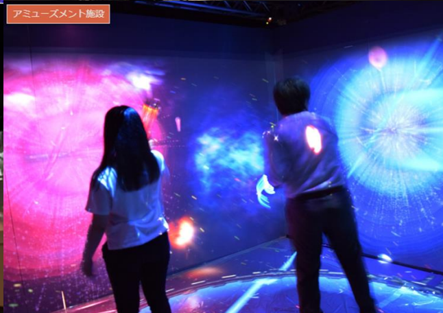
アミューズメント施設