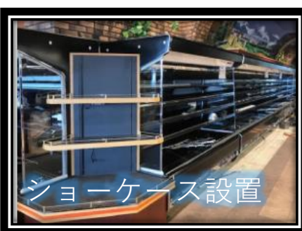
ショーケース設置