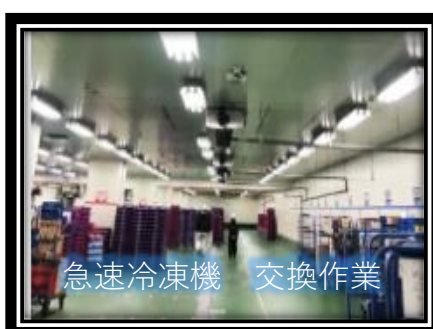
急速冷凍機 交換作業