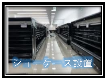
ショーケース設置