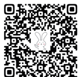
公式ホームページ