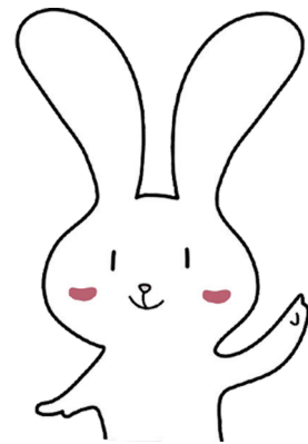
新宿わかものハローワーク キャラクター“のびらび”