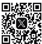
X (旧 Twitter)