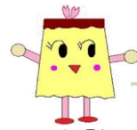
ハローワーク王子キャラクター プリンちゃん