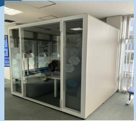
ハローワーク墨田2階ブース