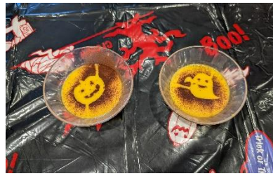
イベントのおやつ（ハロウィン）