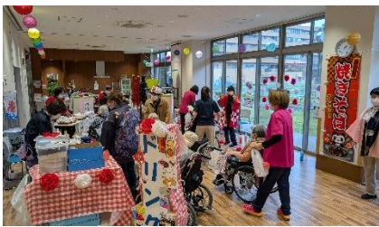
イベント（あおば祭り）