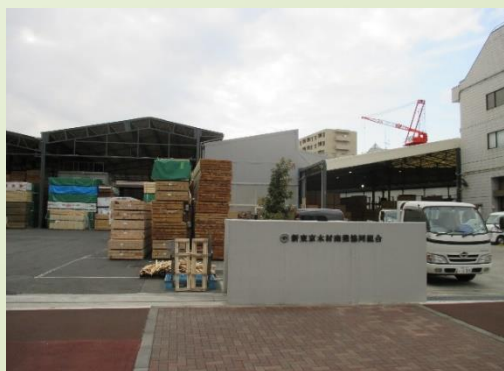
東京メトロ有楽町線 要町駅 徒歩1分