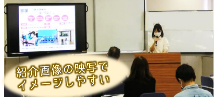
紹介画像の映写でイメージしやすい