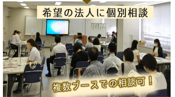
複数ブースでの相談可!