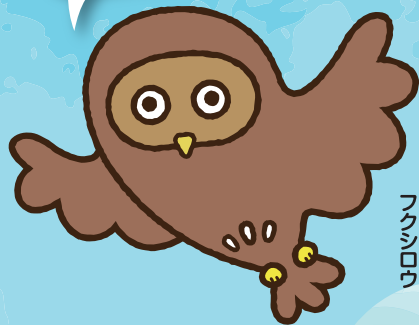
東京都福祉人材センター フクシロウ

三鷹市内の福祉施設・事業所(障がい・児童・高齢)の求人があります。フルタイム、パートなど雇用スタイルも様々です。