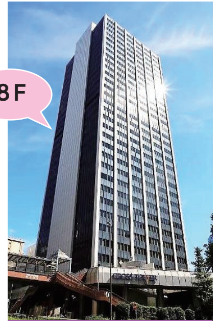
渋谷クロスタワー