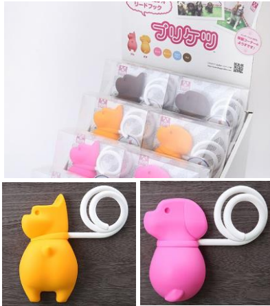
ペット用リードフック 「プリケツ」

大正7年の創業以来、時代のニーズと共に、家電部品・工業用品・自動車部品始め、さまざまな産業に挑戦してきました。ゴムの特性を活かした自社商品の開発も積極的に進めています。ゴムや樹脂の特性を知り尽くしているからこそ発想できるユニークな製品にも挑戦しています。