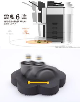
震度6強 新潟県中越地震 想定時 震動法 CDYA 最大約30cm 地震時にコピー機暴走をとめる 「ヒト☆フンバリー」