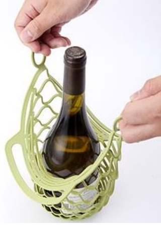
シリコン製ボトルホルダー 「BURINE」