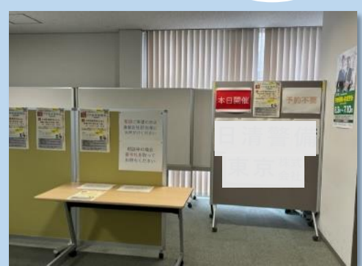
ハローワーク墨田 2階特設ブース

ハローワーク墨田にて来所された求職者と 1対1 で会社・業界説明していただきます。 「求職者が予約不要で会社・業界について 聞くことができる」イベントです（この場で 面接はできません ）。 参加には、墨田区・葛飾区周辺の就業場所の 求人が出ていることが必要です。