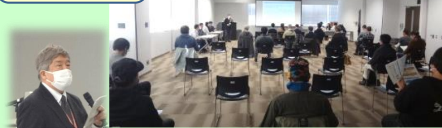
← 司会進行&3業界の概要紹介 奥田ナビゲーター