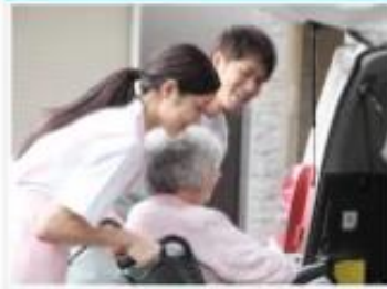
短期入所生活介護 (ショートステイ)