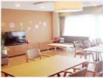
特別養護老人ホーム