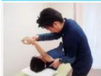
通所リハビリテーション