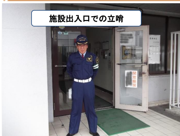
施設出入口での立哨