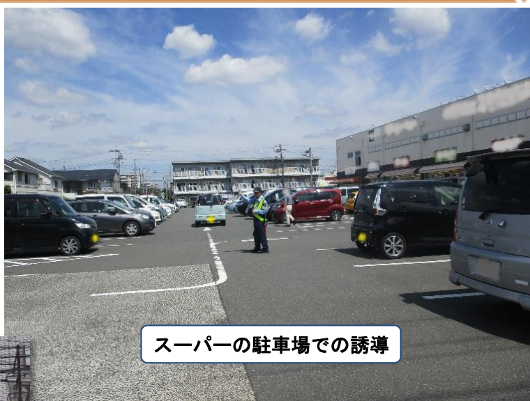
スーパーの駐車場での誘導