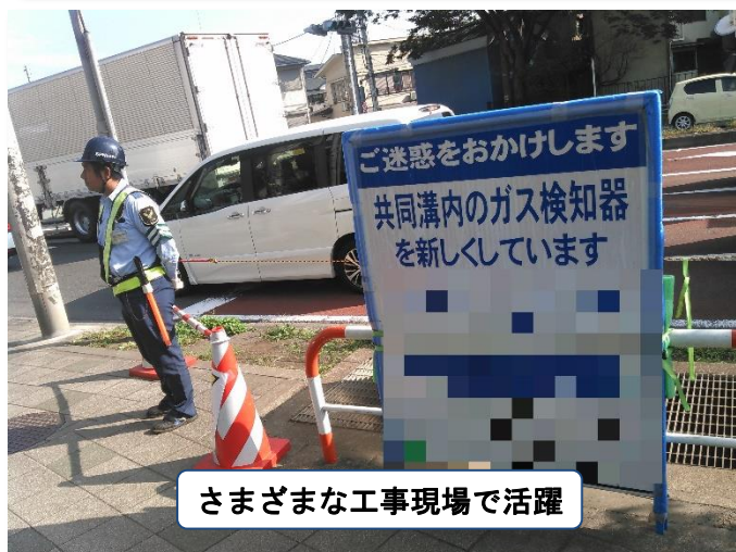
さまざまな工事現場で活躍

研修の最終日には、実際に配属される予定の現場に先輩従業員と一緒にいき、しっかりと実際の指導を受けていただきます。