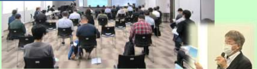
司会進行 & 3 業界の概要紹介 奥田ナビゲーター →