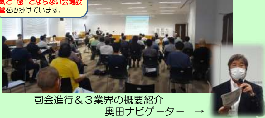
司会進行 & 3業界の概要紹介 奥田ナビゲーター →