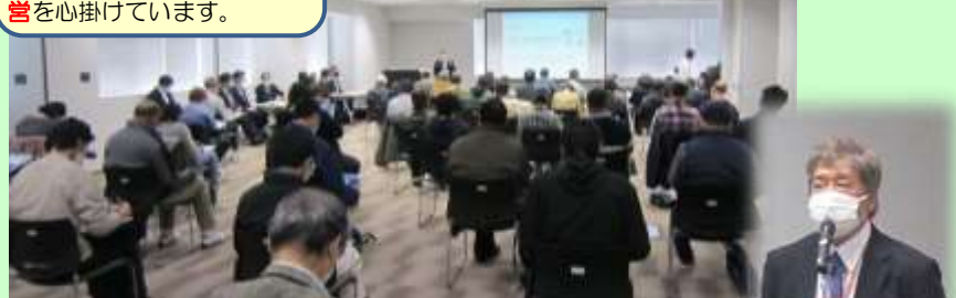
司会進行 & 3業界の概要紹介 奥田ナビゲーター →