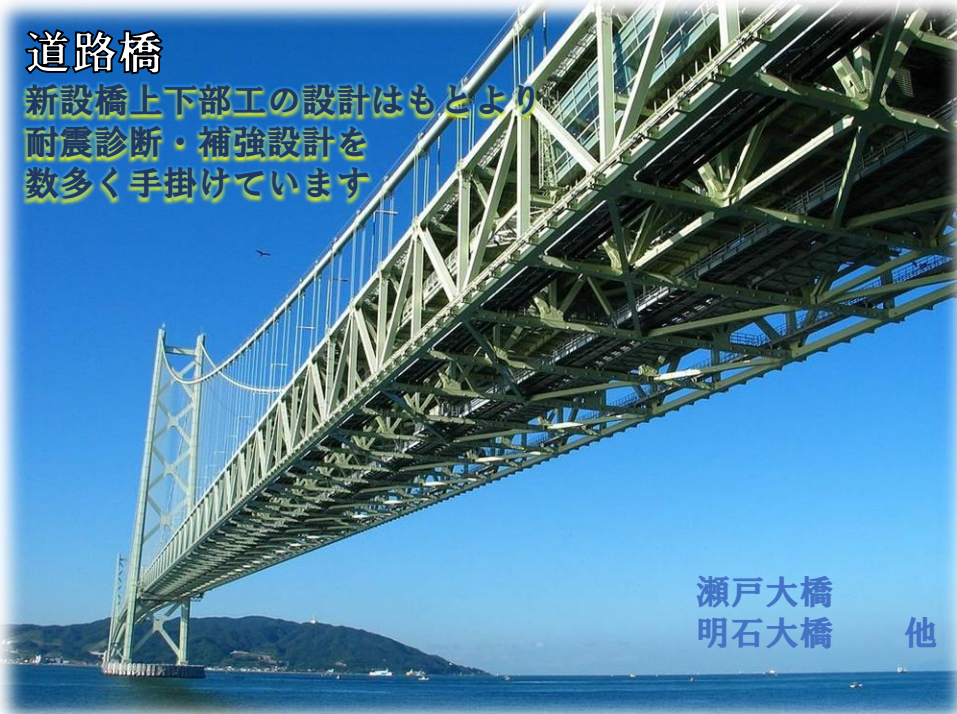
瀬戸大橋 明石大橋 他