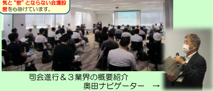
司会進行 & 3業界の概要紹介 奥田ナビゲーター →