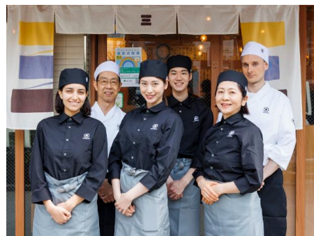
シニアの活躍人数