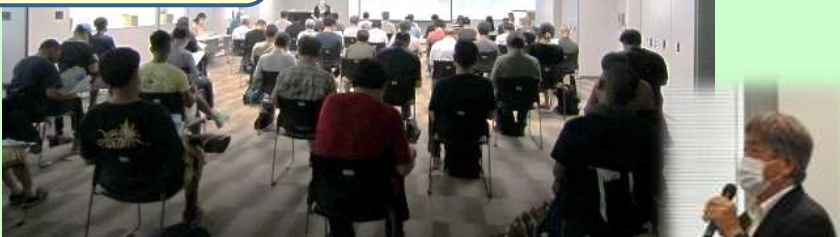
司会進行 & 3 業界の概要紹介 奥田ナビゲーター →