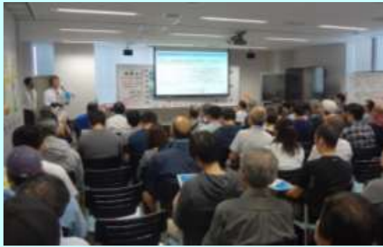
↓ セミナー会場の様子 (ハローワーク立川 2 階会議室)