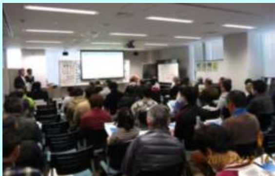
↓ セミナー会場の様子 (ハローワーク立川2階会議室)