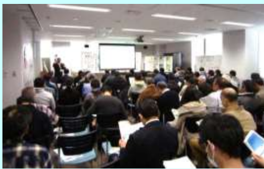
↓セミナー会場の様子 (ハローワーク立川2階会議室)