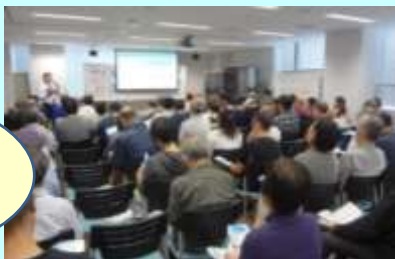
↓セミナー会場の様子～11月度開催（ハローワーク立川2階会議室）

参加者の内訳では男性が9割程度を占めており、女性には就職先として“選択しにくい”業界であることがうかがえます。