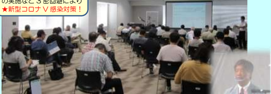
司会進行 & 3業界の概要紹介 奥田ナビゲーター →