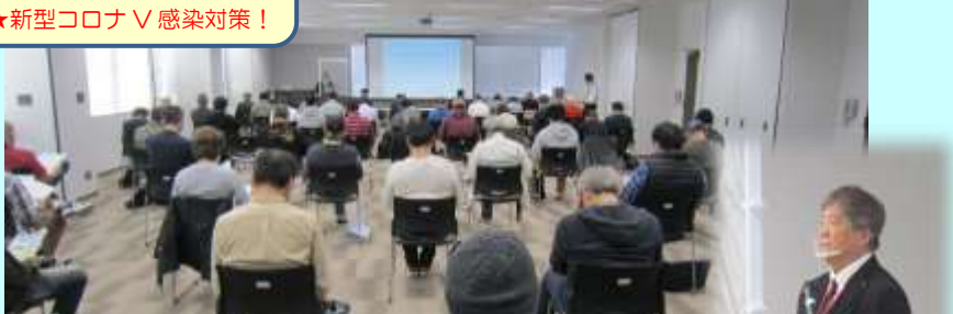
司会進行 & 3 業界の概要紹介 奥田ナビゲーター →