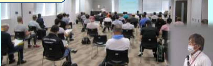
司会進行 & 3 業界の概要紹介 奥田ナビゲーター →