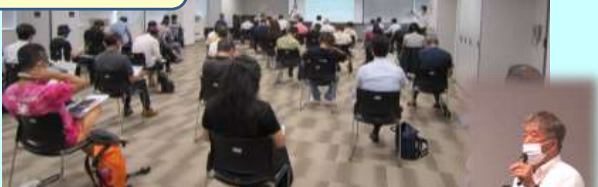
司会進行 & 3業界の概要紹介 奥田ナビゲーター →