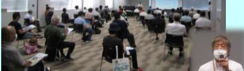
司会進行 & 3業界の概要紹介 奥田ナビゲーター →