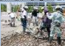
当社も施工に参加！

ジェイワンは大手ゼネコンのもと、 土間コンクリート押え工事の一次専門工事業者 として1993年に創業しました。社名は 「日本のJ」と「一番最初にチャレンジする」 、つまり 誰もやっていないことを開拓していく精神を大切にしたい という思いを込めています。 土間工事とは国立競技場などスタジアムやマンション等の大型建築物を建てる際に、 土台となる床の部分に生コンクリートを流し込み、傾かないように平らにする工事 です。 当社独自の 育成プログラム「現場スキル教育」・「コミュニケーション教育」 でキャリアアップをサポート！